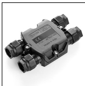
3114174 Connettore 4 vie IP68