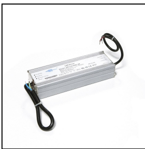
310950 Kit driver - CV 100 W - 48 V