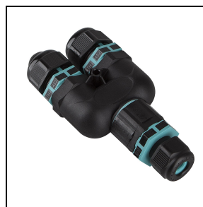
310496 Kit derivazione Y 3 VIE Ø 7-10,5 mm IP 68