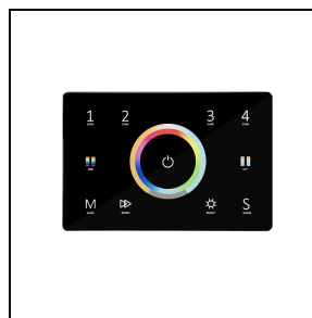
3117845 Controller DMX touch black BK-81 / Nero