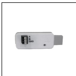
3115612 USB key EcoEcco