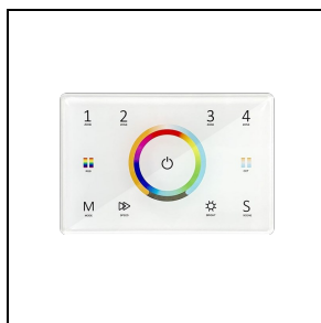
3117844 Controller DMX touch white WH-87 / Bianco