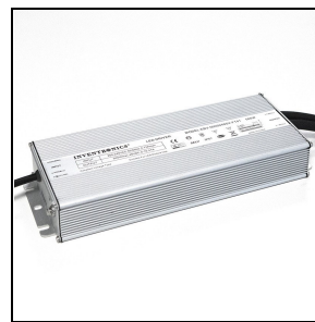
310951 Kit driver - CV 500 W - 48 V