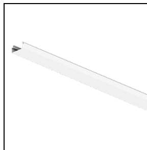
310553 Coperchio PC RAIL - L 1435 mm ☐ WH-RAL9003 / Bianco WH-RAL9003