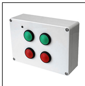
14477420 Pulsantiera wireless a quattro tasti configurabili

Al fine di favorire un costante aggiornamento dei propri prodotti, PERFORMANCE iN LIGHTING si riserva il diritto di apportare modifiche senza preavviso. Si invita pertanto a prendere visione dell'ultima versione pubblicata sul sito www.performanceinlighting.com . Flusso luminoso e potenza elettrica sono soggetti ad una tolleranza di +/-7% rispetto al valore indicato. Salvo diversa indicazione, i valori si riferiscono a una temperatura ambiente di 25 ° C. I termini di garanzia sono consultabili all'indirizzo https://www.performanceinlighting.com/gr/company/led-warranty