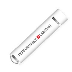
14469720 Chiave USB da abbinare a PC per programmazione wireless