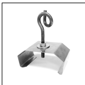
3100245 Staffette per fissaggio rapido a soffitto in acciaio inox + ganci (2 pezzi)