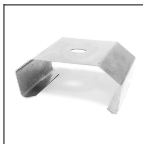
3100244 Staffette per fissaggio rapido a soffitto in acciaio inox (50 pezzi)