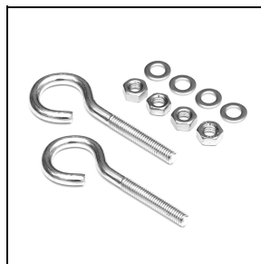
310550 Sospensione per catena