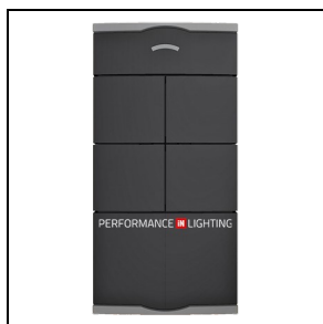
14469820 Telecomando a quattro tasti configurabili