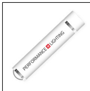
14469720 Chiave USB da abbinare a PC per programmazione wireless