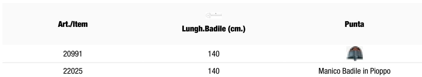
Tabella varianti articolo