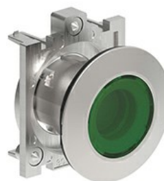
Operatori pulsanti luminosi passo- passo - Rasati LPFQL10