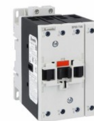
Contattore di potenza BF65