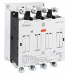
Contattore di potenza BF230