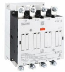
Contattore di potenza BF195