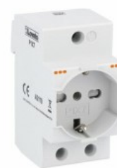
Presa modulare 16A standard italiano e tedesco P1X7 2.5