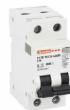
Residual current circuit breakers (RCCB) with overcurrent protection P1RE 1P+N 2 IEC