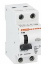
Interruttore magnetotermico differenziale monoblocco P1 RB 1P+N 2 IEC