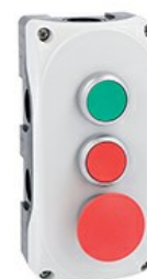
Pulsantiera grigia LPZP3A8 completa con pulsante rasato verde lpbc103 1NA, pulsante rasato rosso LPCB104 1NC e pulsante a fungo a impulso LPCB6144 LPZP3B8912