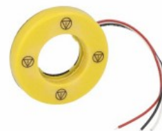
Disco luminoso per pulsanti a fungo - ISO13850 SYMBOL LPXDAU