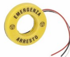
Disco luminoso per pulsanti a fungo - EMERGENZA ARRESTO LPXDAU