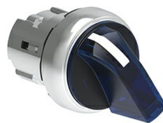
Operatori selettori a leva luminosi - 3 posizioni LPSSL13