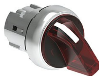
Operatori selettori a leva luminosi - 2 posizioni LPSSL12