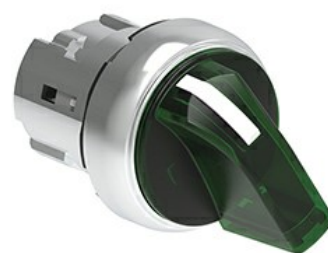
Operatori selettori a leva luminosi - 2 posizioni LPSSL12