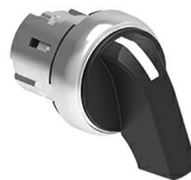
Operatori selettori leva lunga - 3 posizioni LPSS23