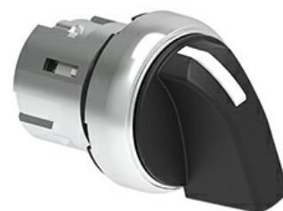
Operatori selettori leva - 3 posizioni LPSS13