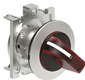
Operatori selettori a leva luminosi - 3 posizioni LPFSL13