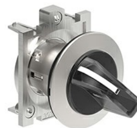
Operatori selettori a leva luminosi - 3 posizioni LPFSL13