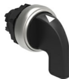
Operatori selettori leva lunga - 3 posizioni LPCS23