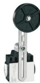
A leva regolabile con rotella KNF