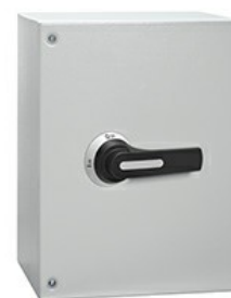
Commutatore a camme in cassetta GLZM