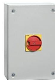
Interruttori sezionatori in contenitore GAZM