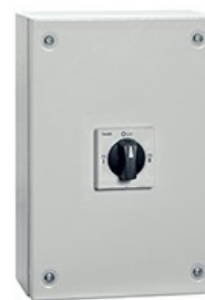
Commutatore a camme in cassetta GAZM