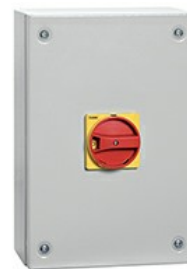
Interruttori sezionatori in contenitore GAZM