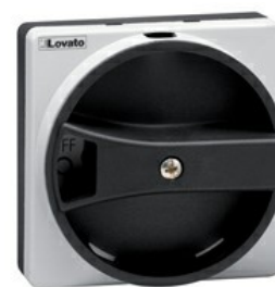
Maniglie per sezionatori GAX6