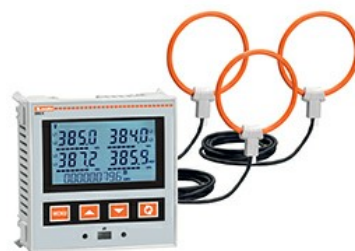
Multimetri LCD da pannello. Espandibili DMG611 Trifase + neutro