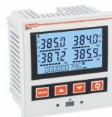
Multimetri LCD da pannello. Espandibili DMG610 Trifase + neutro