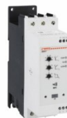
Soft starter - versione avanzata ADXNP Asincrono trifase