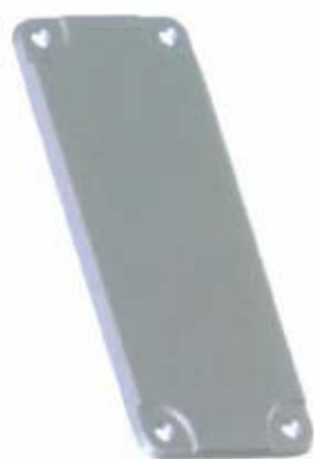
Immagine del prodotto / Product image