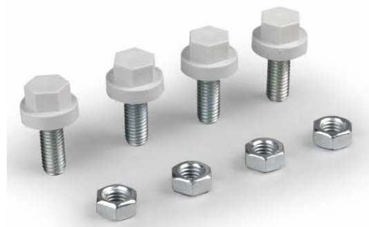
Viti in acciaio Steel screws