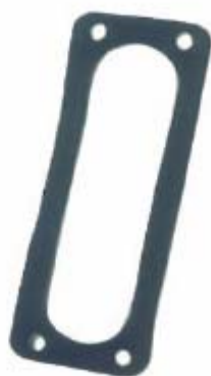
Immagine del prodotto / Product image