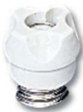
Immagine del prodotto / Product image