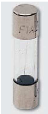
Foto del prodotto / Product image