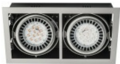
L'immagine è puramente a scopo illustrativo del prodotto The picture is for illustrative purposes only