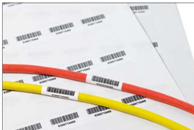
Grazie alla laminazione si ottiene una identificazione a lungo termine.

Per semplici modelli di stampa in Word, visita: www.HellermannTyton.it/modelli-etichette