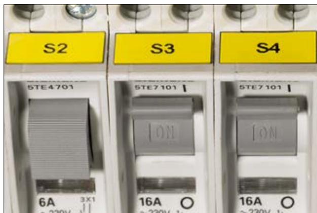
Etichette facili da identificare garantiscono una facile gestione dei cablaggi.