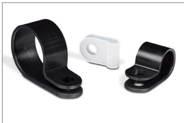
P-Clip H1P - H18P in diverse misure.