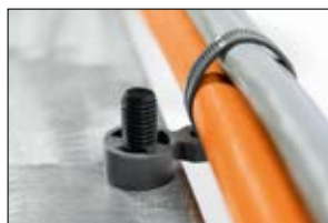
T50SOSSBU-M8/10 per legare fasci che passano sotto al perno.