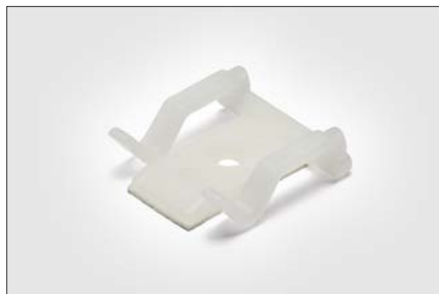
TY8H1, basetta adesiva per cavi flat.