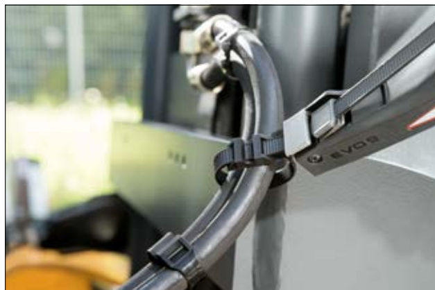
La serie LPH presenta una superficie liscia verso il cablaggio.