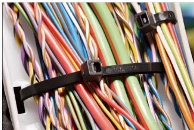
Fascette standard della serie T - per qualsiasi tipo di applicazione (PA66).