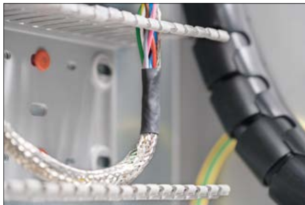
TF21 - disponibile in molti colori e dimensioni.

Ulteriori colori disponibili su richiesta.