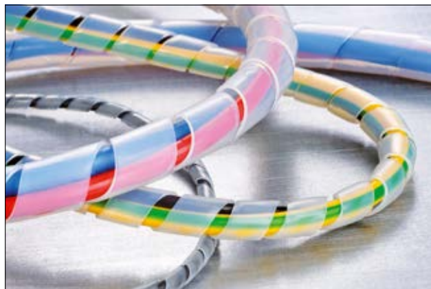
Spirali SBPTFE - ideale in condizioni estreme.