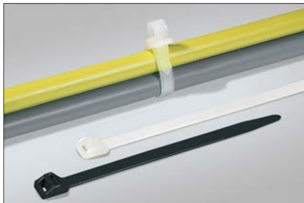
Ideali per legare fasci grandi o pesanti, queste fascette possono essere aperte e riutilizzate.