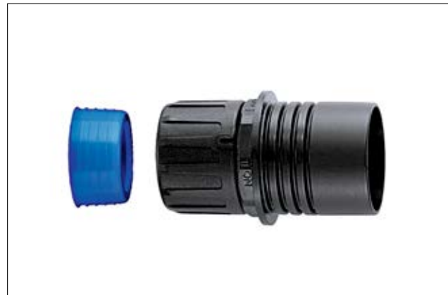
HGL-R Riduttore con guarnizione, IP68.