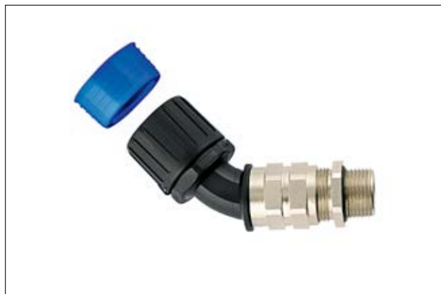
HelaGuard HGL-45CG Raccordo curvato a 45° con pressacavo, IP68.